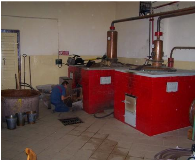
A Kistárkányi pálinkafőzde.

Kistárkány a Tisza-kerteknek köszönhetően elsősorban a szilvapálinkájáról volt híres. A pálinkafőzés hagyománya a mai napig megmaradt. Mivel a Tisza-kerteket az Állami Gazdaság 1976-ban kikapusztította, a lakosság a saját kertjeiben termesztett a szilva- és egyéb gyümölcsfák terméseiből készíti a cefrét, melyet a helyi pálinkafőzdében főzik ki, amelyet maga a község üzemeltet.