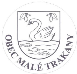
Vlajka a pečať obce